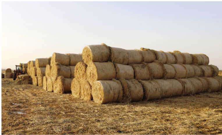
11月17日,青口r投资公司自营农稻田水稻收割全部结束。今年自营水稻收割总产750多万斤,收割平均亩产1376.30斤,其中最高条田组单产达到1573斤。图为收割完成后,利用机器将秸秆回收所堆砌的草垛。(陈琛)

优化服务,加班加点保后勤、助创文。对标开发区对创文工作提出的新要求,公司严格按照“保质量、赶进度、求实效”的工作方针,紧盯重点环节、重点区域、重点路段,加大工作力度,念好“擦、洗、抹、捡、扫”五字经。公司承接开发区 23 条主干道路灯维修,辖区路灯总亮率达到 99%。此外,公司对辖区内活动广场、公园及居民区等人口密集的场所以进行重点监控,及时清空积存垃圾,确保当日垃圾随产随清,垃圾清运班年清运量达 7000 余吨。(王芬)