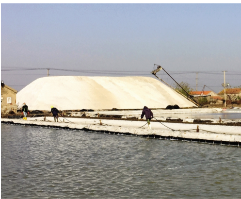
11月15日上午,台北海州湾公司秋扒工作顺利完成,共扒格块192块,面积3309亩,盐量3.1万吨,超额完成秋扒盐量3万吨任务。(杜红波)

▲日前,灌西投资公司举办“不忘初心、牢记使命”主题教育知识竞赛,全面检阅该公司深入学习贯彻习近平新时代中国特色社会主义思想和“不忘初心、牢记使命”主题教育的学习效果,进一步展示“正风肃纪,争当清廉国企人”和“坚守初心使命、奋力担当作为,推动灌西公司高质量发展”学习讨论活动成果。(张明建)