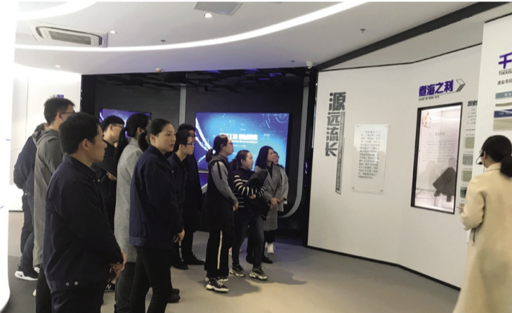
11月15日,奥神新材料公司组织党员、技术骨干参观学习集团公司展厅和氨纶公司八期工程。通过现场参观学习,让奥神新材的员工对集团的发展有了更深入的了解,进一步激发广大员工为企业的发展贡献一份力量的责任感与使命感。(奥神新材料)

哪怕一年只剩下三分之一不到的时间,我们也要拥抱阳光,不畏将来。如果让我选择一种颜色,那一定是我爱的晚秋——温暖的橘红!