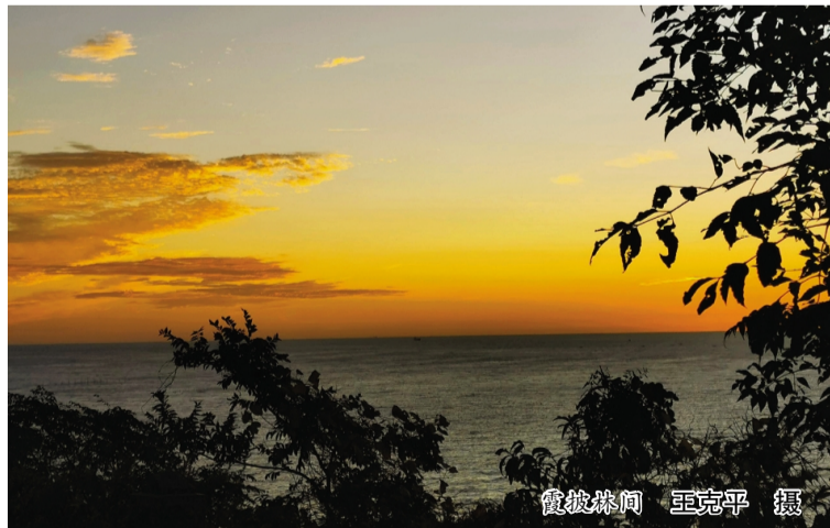
霞披林间