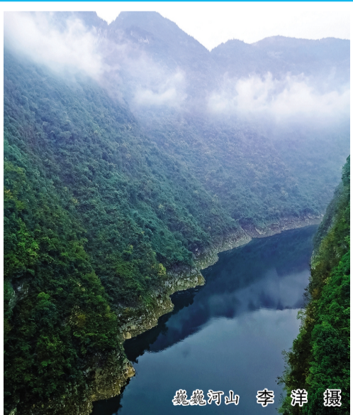
巍峨河山