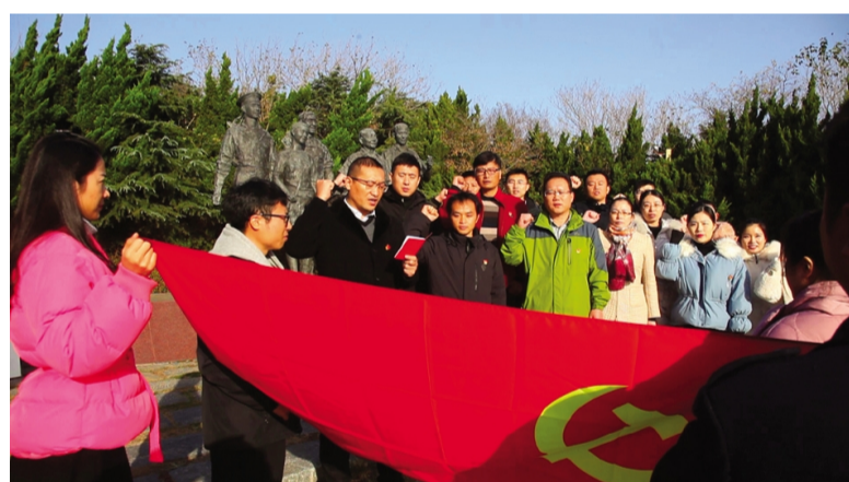
为深入开展“不忘初心、牢记使命”主题教育，提高组织生活质量和水平，11月20日，利海化工公司第一党支部组织20名党员、积极分子、职工群众来到爱国主义教育基地“邓小平和人民在一起”公园进行开放式组织生活，重温革命历史，传承红色基因，牢记使命。