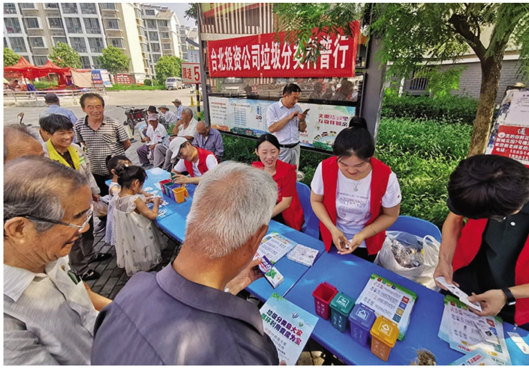
8月16日上午,台北投资公司青年志愿者走进昌圩湖社区,开启“垃圾分类”科普之旅,并走进老党员家中畅谈“初心”、畅谈“使命”,进一步坚定广大青年员工立足企业争贡献的信念。