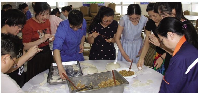
为丰富一线职工伙食,提高员工幸福指数,8月14日下午,利海化工公司女工委组织开展“包饺子送一线”活动,让基层一线员工进一步感受到工会娘家人的温暖,增进团队协作和凝聚力,营造了企业和谐氛围。图为“包饺子送一线”活动现场。