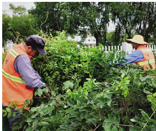
近日,华茂益丰园林公司员工正繁忙地对园区内培育的紫藤盆景进行修剪,促使其花芽分化,让枝条充分吸收土壤养分,待到明年春季紫藤花开即可上市销售。