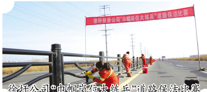
徐圩公司“巾帼岗位大练兵”道路保洁比赛