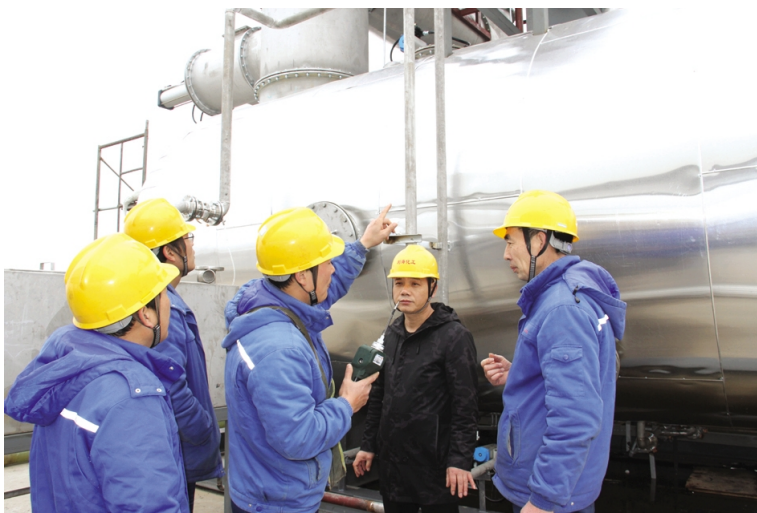
利海化工公司双氧水优化改造项目全部完工。3月5日，经过2天紧张调试，各个环节运行情况良好，试车取得一次性成功。图为技术人员在现场查看设备调试情况。