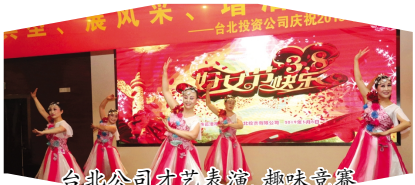
台北公司才艺表演、趣味竞赛