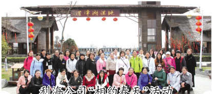
利海公司“相约春天”活动