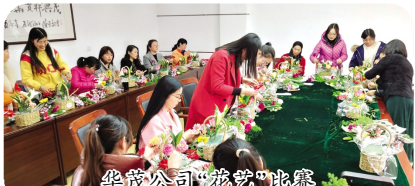
华茂公司“花艺”比赛