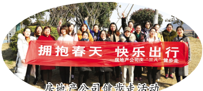
房地产公司健步行活动