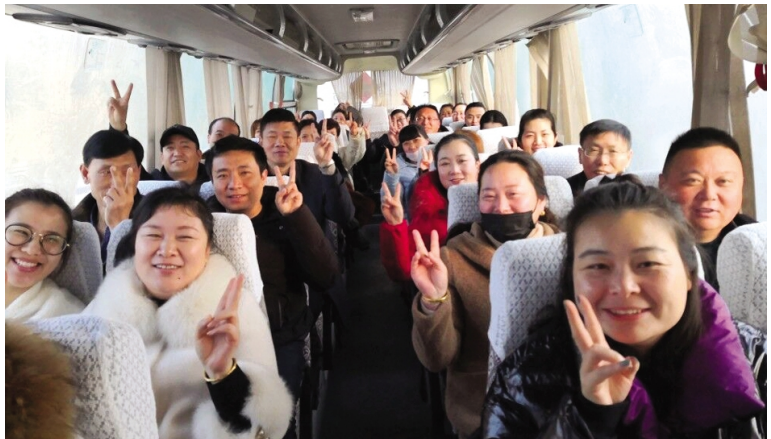
3月的第一天,在集团支持和关心下,徐圩投资公司2019年度“十大惠民实事”之一的市区至辛圩的两辆职工通勤车正式运行。通勤车的开通,不但开通了职工上班的方便路,更架起了党群干群“连心桥”。(侍作华 戴月婷)