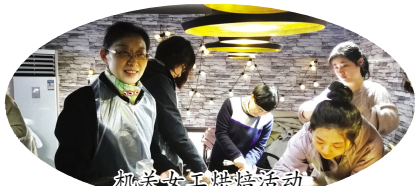
机关女工烘焙活动