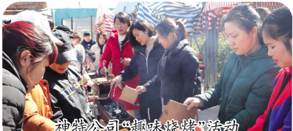
神符公司“趣味烧烤”活动