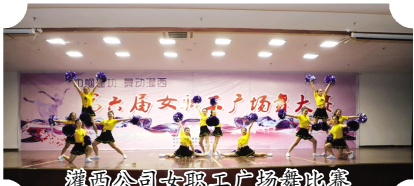
灌西公司女职工广场舞比赛