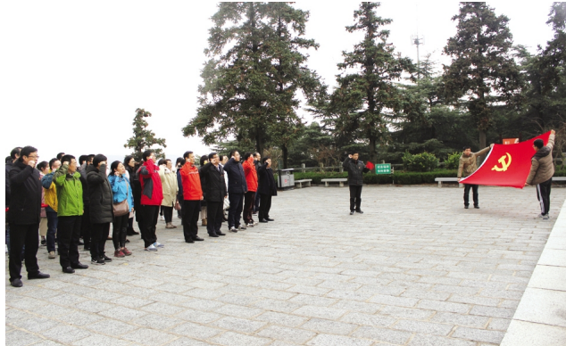
为进一步强化基层党组织建设,创新教育实践形式,充分发挥党组织的战斗堡垒作用和党员的先锋模范作用。近日,房地产公司与供电公司联合组织五十余名党员赴赣榆抗日烈士陵园开展“传承红色基因、坚定理想信念”主题党日。 (房宣电宣)