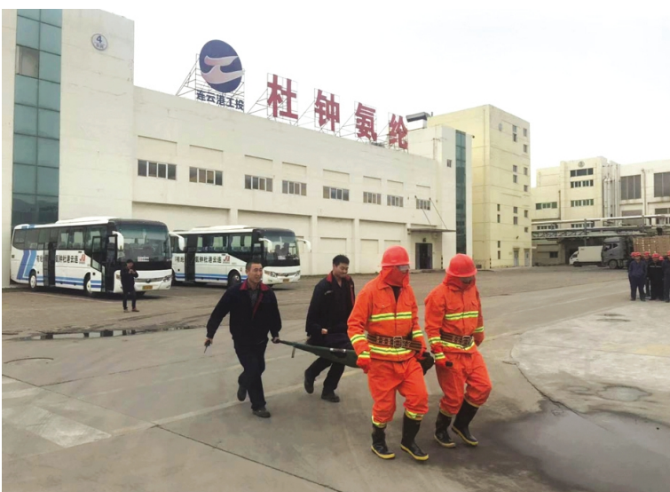
为了进一步加强应急救援管理工作,12月4日下午,氨纶公司开展“卷绕间爆燃起火”应急演练,公司安全人员、四期纺丝、聚合人员、化验室、四期品保人员等80余名员工参与演练。(氨纶宣)

企业管理得到新提升。强力推进机制改革创新,进一步完善班组承包责任制、风险抵押金和绩效考核机制;修订“星级员工”管理办法,先后命名表彰了11名“星级员工”。制定《资金管理办法》,全年“三费”支出压缩30%。以“隐患排查月”和“安全生产月”等系列活动为抓手,强化现场安全管理,从源头杜绝安全事故的发生。(季兴胜)